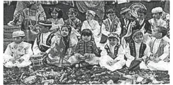
الفرقيعان ص ١١٩