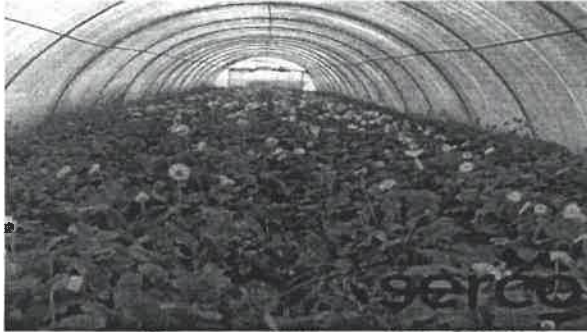
بيوت بلاستيكية ص ٩٤

(ج) أمامك مجموعة من الصور ضع تحت كل صورة عنوانا مناسباً لها :