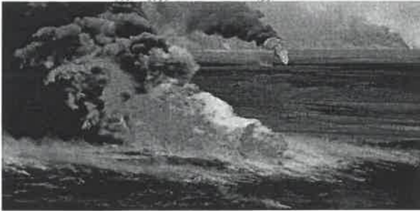
إحراق النظام العراقي البائد أبار النفط في الكويت - تدمير البيئة - تلوث تربة ص ١٣٩