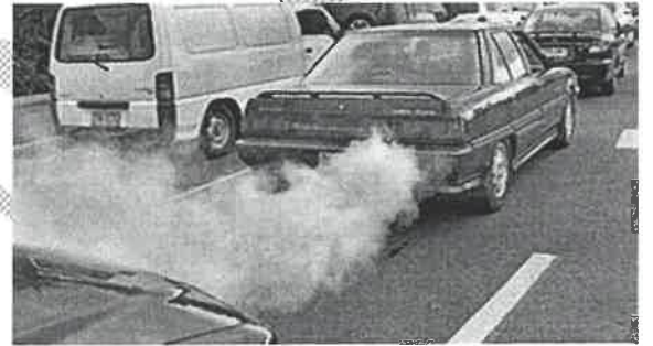
التلوث الهوائي ص ١٣٣